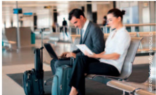
Keleiviams ES užtikrinamos pagrindinės teisės: teisė gauti informaciją, pagalbą ir kompensaciją, jeigu kelionė atšaukiama arba ilgai vėluojama.